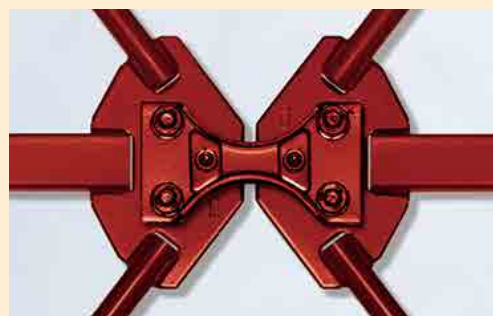
制震フレーム「ハイパワードクロス」 (ハイパワード制震ALC構造)