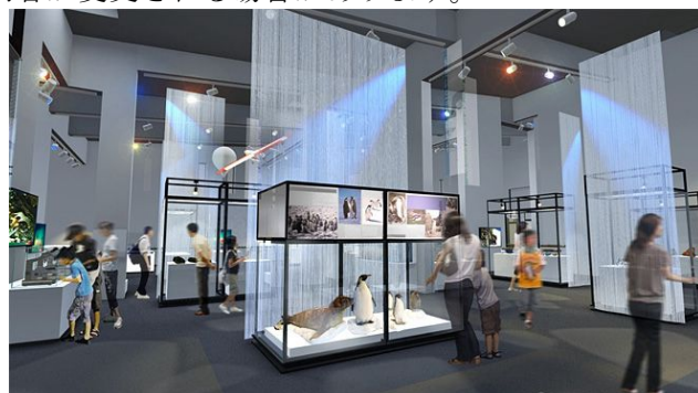
南極・北極科学博物館(自由見学30分)

①地震体験②煙体験③防災ミニシアター を予定しております。いずれも施設設置の 設備なので本格的な体感ができます。